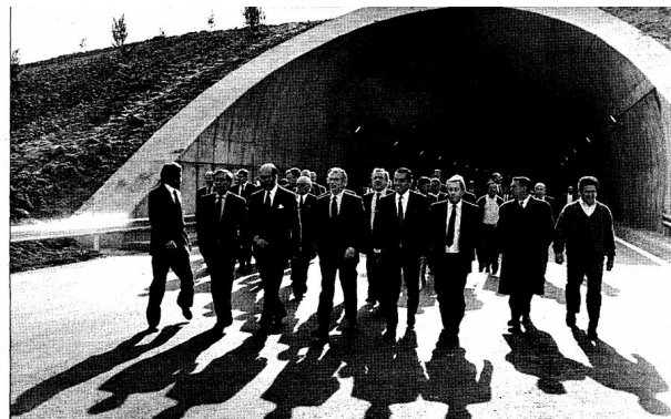
El ministro de Obras Públicas, rodeado de altos cargos, en la inauguración del nuevo tramo de la autovía del Norte.

construcción de dos túneles, de 600 metros de longitud con 3 carriles por sentido, que permiten salvar el puerto de Somosierra. Con la culminación de esta autovía