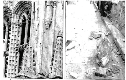
La catedral de Burgos, abandonada, se cae a pedrazos: se derrumba de una cornisa una estatua de dos metros de altura

produciendo diversos destrozos. La figura, del siglo XVII, tenía dos metros de altura y estaba adosada al cuerpo de la torre de la catedral a través de una peana mediante un mecanismo de hierro y plomo reforzado con yeso. Las piedras no han alcanzado a ninguna persona, aunque minutos antes de desplomarse la plaza de Santa María estaba repleta de público que salía de una boda en la catedral. Solo ha