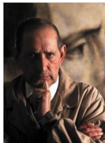
Muere Miguel Delibes, la grandeza de la sencillez